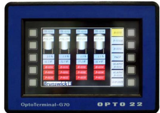
Personal de planta recibiendo el entrenamiento en la operación del sistema (izquierda); terminal de operación OptoTerminal-G70

El cliente quedó gratamente sorprendido con Opto 22, una marca que desconocía, básicamente por las siguientes razones: