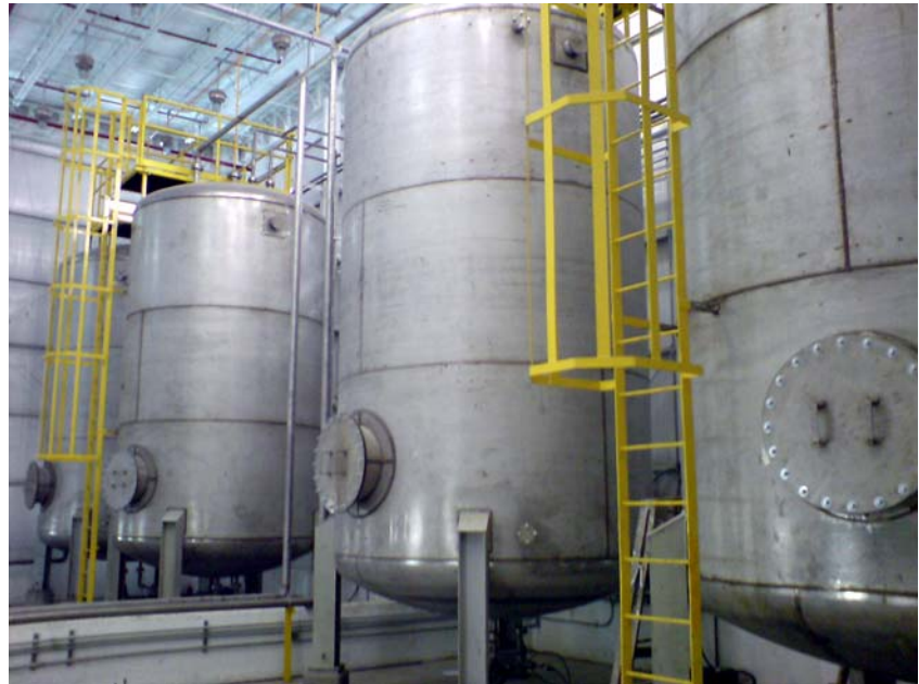
Vista parcial del patio de tanques de Brunswick

conexión Ethernet. Este estándar es muy sencillo y eficiente. Además, a esto hay que agregarle que para interactuar con los operadores se usa una pantalla OptoTerminal-G70, que ofrece una interfaz dinámica a color y muy amigable y lo mejor . . . también es Ethernet.