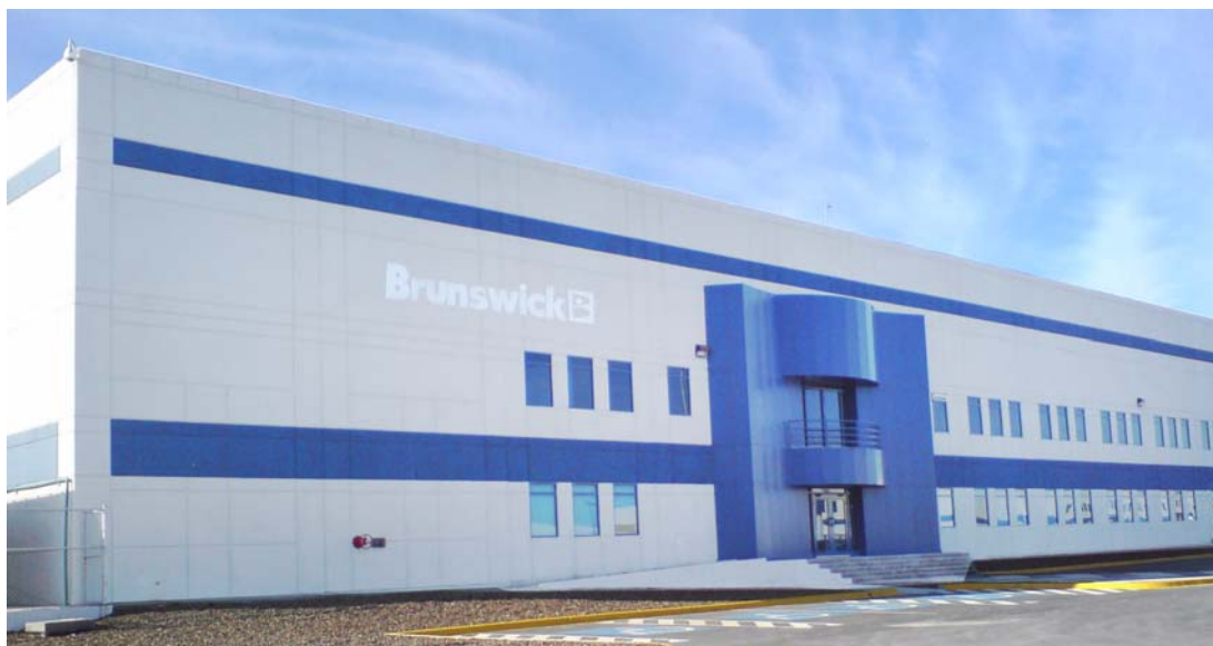
Planta de Brunswick Bowling & Billiards ubicada en Reynosa, Tamaulipas, México.

En la frontera norte de México es muy común encontrar empresas que trasladaron sus operaciones de otras partes del mundo a México (maquiladoras) aprovechando la mano de obra calificada con que cuenta nuestro país, el bajo costo comparado con el país de origen y la cercanía con los Estados Unidos. Este es el caso de Brunswick Bowling & Billiards quienes trasladaron sus operaciones de Muskegon, Michigan a Reynosa, Tamaulipas.