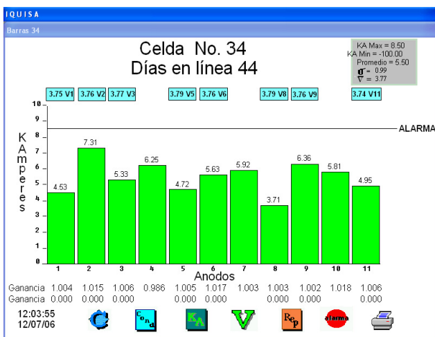
En esta pantalla se observa el monitoreo de una de las celdas.

Fundada en 1974, Opto 22 es una fábrica líder en soluciones de equipo y programas de alta calidad para conectar dispositivos del mundo real con redes de computadoras. Las aplicaciones posibles incluyen la administración empresarial, monitoreo y control remoto, automatización industrial y la adquisición de datos. Opto 22 fue una de las primeras compañías en reconocer e implementar soluciones que involucran redes, computadoras y equipo y dispositivos del mundo real. Más de 85 millones de dispositivos alrededor del mundo están conectados confiablemente a sistemas de Opto 22.