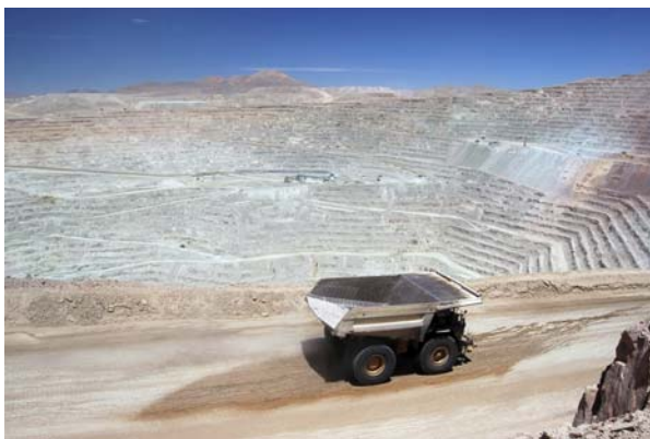
Minerales son extraídos en minas a cielo abierto.

Una empresa en la provincia de El Loa produce cobre por lixiviación de minerales oxidados y sulfurados, extraídos de su minería a cielo abierto. En la lixiviación de cobre, miles de toneladas de mineral se colocan en filas largas llamadas "pilas de lixiviación" y son rociados continuamente con ácido sulfúrico. El cobre se recupera de este proceso. Más de 120 sistemas individuales de automatización de Opto 22 son parte del sistema global que supervisa y controla el suministro preciso de ácido sulfúrico a cada plataforma de lixiviación. Los sistemas de Opto 22 monitorean la presión